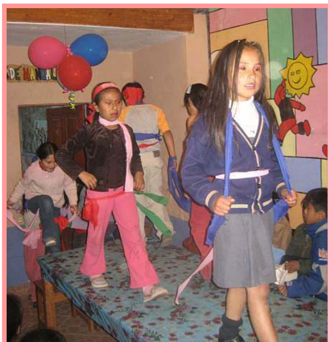
De modellen op de catwalk.