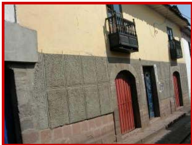
Het huis waar we interesse in hebben.

Vorige week zijn we naar een pand wezen kijken wat eventueel als opvanghuis kan dienen. De eigenaar wil het verkopen, maar de 18 kamers die het huis heeft worden verhuurd en die kunnen we dus niet zien. Ik heb de eigenaar heel netjes uitgelegd dat ik de koop van dit huis zelfs nog geen seconde overweeg als ik niet alle vertrekken gezien heb. Hij zou er dit weekend voor zorgen dat we alle kamers kunnen bezichtigen, maar hij belt ons niet terug en ook dit gaat dus niet door.