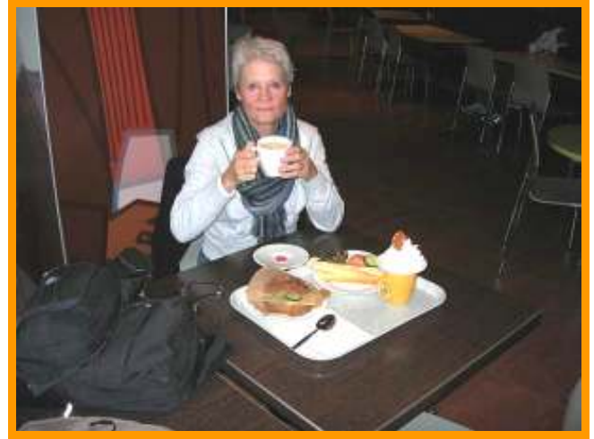
Een laatste Hollands ontbijtje voor vertrek.