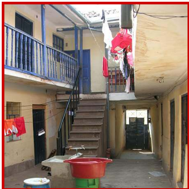
Een van de patio's van het aangekochte huis.

Vrijdag gaan we in alle vroegte naar de Gemeente om de belasting over de aankoop te betalen en vervolgens zitten we uren bij de notaris te wachten tot alle documenten in orde zijn. We zeggen menig keer tegen elkaar: "Que suerte", "Wat een geluk"! Wie had dit ooit kunnen denken, een voorzichtige kleine start voor een eigen toekomst voor ons werk met de kinderen van Inti Huahuacuna. Ik weet dat mijn zorgen er niet minder op worden, want we willen zeker ons werk in de wijken Zarzuela en Tica Tica voortzetten. Tijdens die lange uren wachten bij de Notaris denk ik aan de tekst van een lied van Marco Borsato: "We verbannen de dromen naar morgen en later, maar doet het je stiekem geen pijn dat je dan pas zou doen wat je altijd al wou als er nooit meer een morgen zou zijn". Ik ben zo blij dat ik mijn dromen heb gevolgd en ook al zijn er maar kleine beetjes werkelijkheid geworden, voor mijn gevoel hebben we al zoveel gewonnen. Daarom ga ik nog even verder met dromen en hoop in de komende jaren het geld bij elkaar te krijgen om dit gebouw te verbouwen tot een eigen functioneel opvanghuis. Ik realiseer me ten volle dat ik jullie nog heel hard nodig zal hebben, alleen lukt me dit niet, maar met alles wat ik samen met jullie, het Nederlandse bestuur, de vrijwilligers en het Peruaanse team al heb bereikt weet ik dat ik gerust nog even verder mag dromen.....!