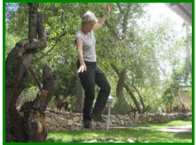
De waarheid ontdekken is continue balanceren.

de eigenaar van het pand waar ik mijn oog op had laten vallen wilde niet op mijn bod ingaan.