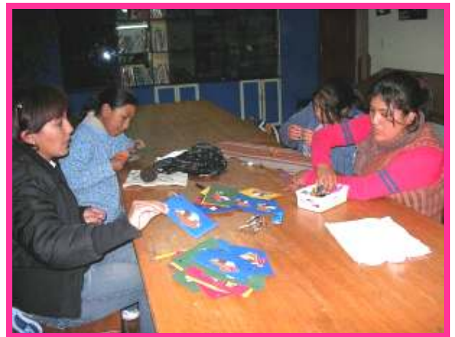
Onze jaarlijkse Kerstklus voor de donateurs.

Woensdagmiddag komt er onaangekondigd iemand van de Gemeente ons keukentje en onze lokalen keuren, of we wel geschikt zijn om een gaarkeuken te starten. Gelukkig wordt alles goedgekeurd, dus we hebben weer een stapje de goede kant uit gewonnen. Zal het er dan toch nog ooit van komen.....!?!