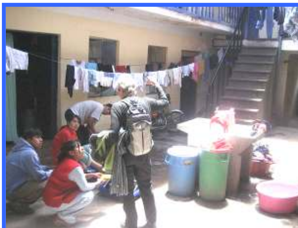
Bezichtiging aangekocht pand