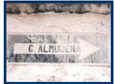
De straat van het nieuwe pand.