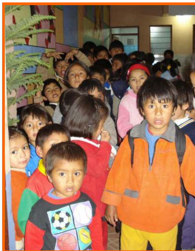
Een lange rij hongerige kinderen.