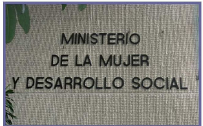
Ons bezoek aan het ministerie.