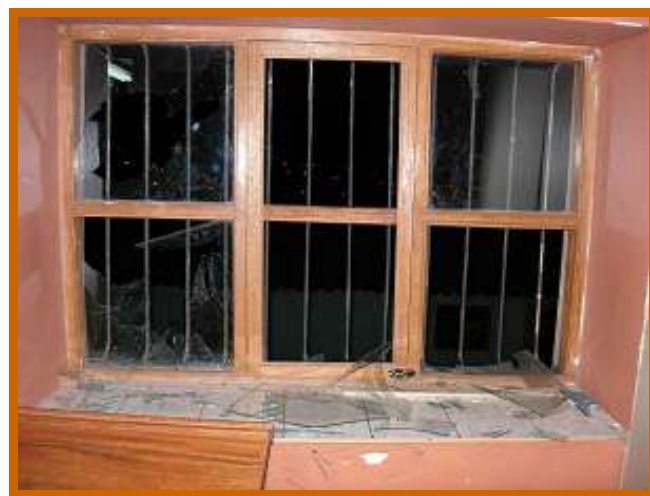
Tijdens de inbraak zijn alle ruiten ingegoooid.

Waar we de afgelopen weken al bang voor waren, is maandagnacht gebeurd. Men heeft geprobeerd in te breken in ons opvanghuis, sloten open gebroken, een metalen deur geforceerd en wel 10 ruiten ingegoooid.