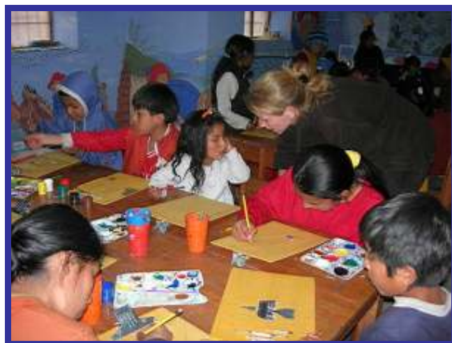
De kinderen beschilderen de bordjes voor het Inca Museum.