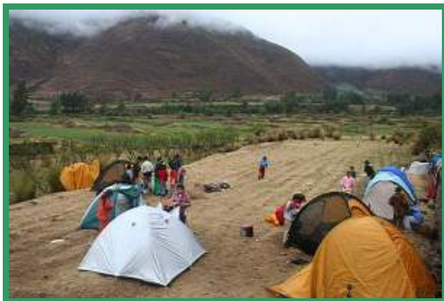
Heerlijk overnachten in de tent.

Na deze spannende dag volgt het ontspannen schoolreisje met onze kleintjes naar Andahuaylillas.