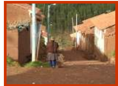
De wijk Tica Tica.