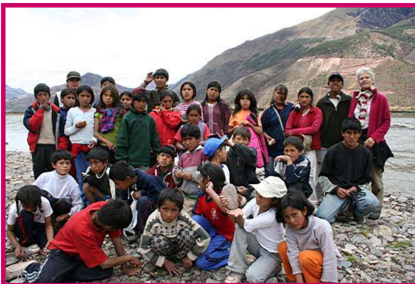
De niños een weekeinde op kamp in Andahuaylillas.