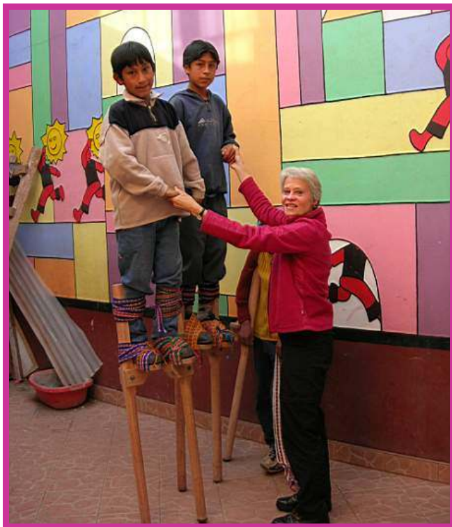
De kinderen krijgen stellooplessen.

deren genieten van zijn lessen. Deze week heeft hij houten stelten meegebracht, die speciaal voor het toneelstuk van onze kinderen zijn gemaakt.