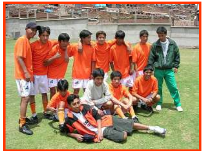
Het Inti Huahuacuna voetbalteam in nieuw voetbaltenue.