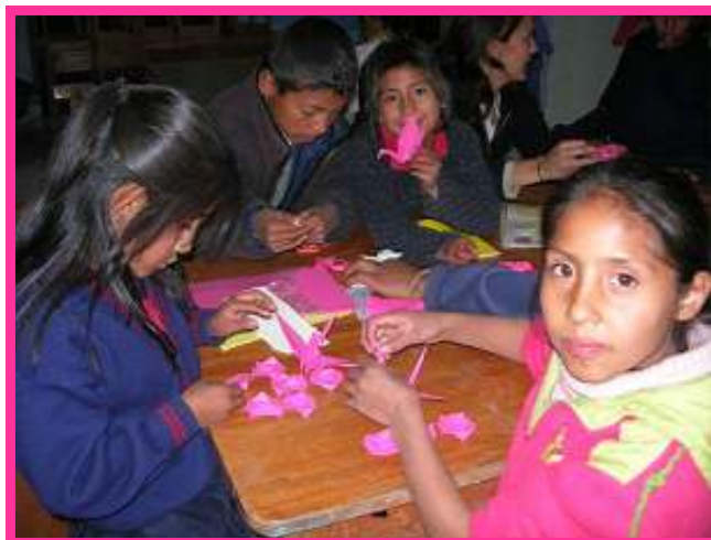
Heerlijk knutselen in het handvaardigheidslokaal.

werken, want ook hier komen veel kinderen. Het allereerste wat voor mij prachtig is om te zien dat dit hele lokaal is ingericht met de oude spullen van de Alianza Francesa, die ik vorig jaar van hen heb gekregen. Het team heeft de kasten, tafels en spelletjes zo goed als mogelijk opgeknaapt en zo hebben deze oude spullen een nieuw tweedehands leven gekregen. Na het project gezien te hebben en in de wijk rondgewandeld te hebben is het mij gelijk duidelijk dat ook deze kinderen deze opvang hard nodig hebben. Helaas kan ik niet de hele middag bij Tica Tica blijven, want bij Inti Huahuacuna zit een computerspecialist op mij te wachten om te praten over de aanschaf van computers voor onze niños. Als educatief centrum willen we dit onze kinderen ook bieden en dankzij een prachtige donatie kunnen we deze droom in vervulling brengen. Maar eerst willen we al onze spullen verzekeren tegen diefstal. Onze wijk is een zeer criminele wijk en het zou niet de eerste keer zijn dat er bij ons wordt ingebroken.