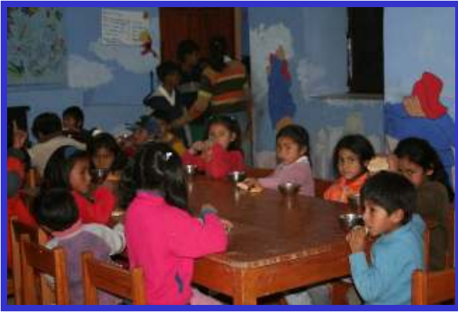
De niños genieten van hun avondmaal.

En dan zit voor mij het venijn in het staartje van de week. Zoveel geluk als ik op zaterdag had, zoveel pech heb ik op vrijdag. Ik weet niet wat ik deze week met mijn rugzak heb, maar op vrijdagmiddag kom ik erachter dat al mijn geld uit mijn portemonnee is gestolen. Gelukkig zat er geen vermogen in, maar toch.....!