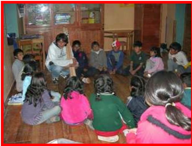
Kinderen krijgen toneelles.