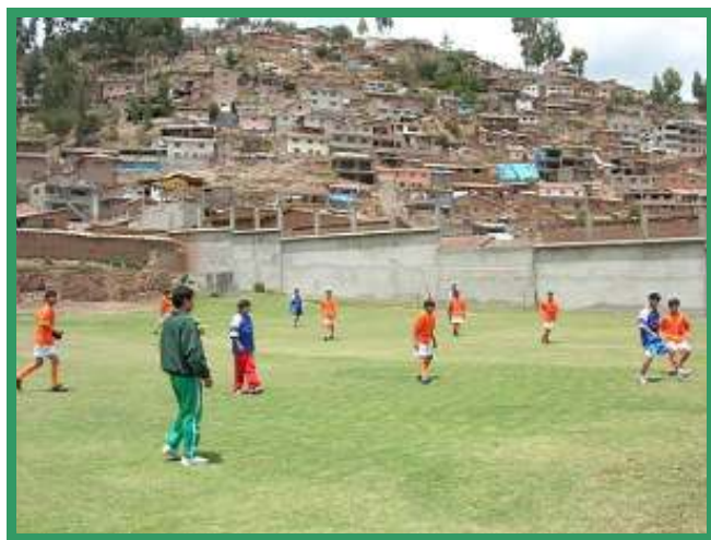
Inti Huahuacuna tegen Qosqo Maki.