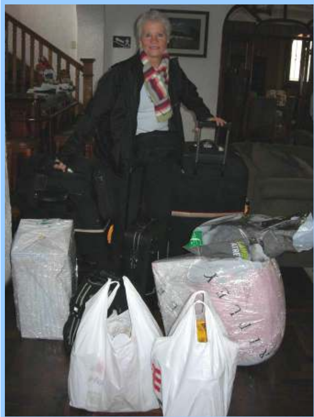
Beladen met 50 kg extra vertrek ik naar Cusco.

Uit alle hoeken van Nederland hebben we fantastische donaties gekregen, waardoor we nu allerlei materialen en apparaten voor het project kunnen aanschaffen. Uiteindelijk zijn we op zondag met 50 kilo extra bagage aan prachtige spullen op het vliegveld door de controle gekomen.