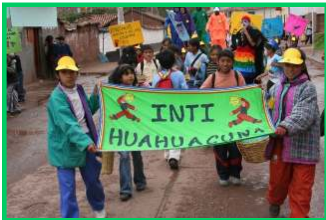
Geschminkt en met spandoeken de straat op.

Afgelopen zaterdag was het zover en gingen we met zijn allen de straat op. Koppies geschminkt, de spandoeken van karton in de hand en zingend over straat.