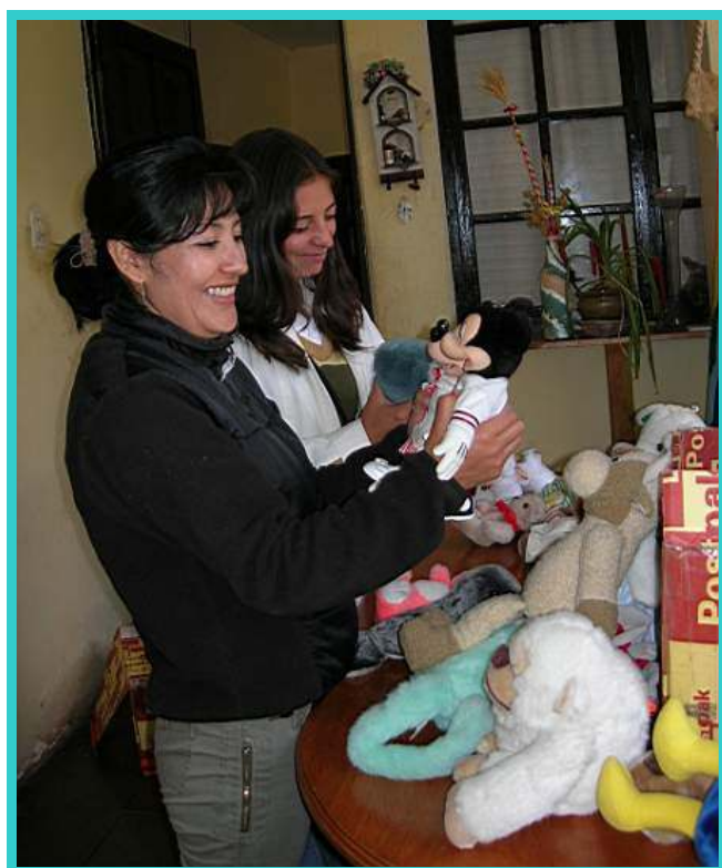
Blijdschap over de aankomst van de materialen.

Op woensdagochtend zie ik tot mijn grote vreugde dat mijn pakketten op het postkantoor zijn aangekomen. In deze pakken zitten ook prachtige knuffeldieren, die een mevrouw uit Uden na haar overlijden aan onze niños heeft nagelaten. Wat ben ik blij dat alles is aangekomen en dat ik ook de laatste wens van deze mevrouw uit kan voeren. De douanebeambte vertelt me echter, zonder een spier op zijn gezicht te vertrekken, dat ik per pak ruim $ 100,- belasting zal moeten betalen, omdat hij goed kan zien dat ik handel ga drijven in Cusco met deze materialen.....!